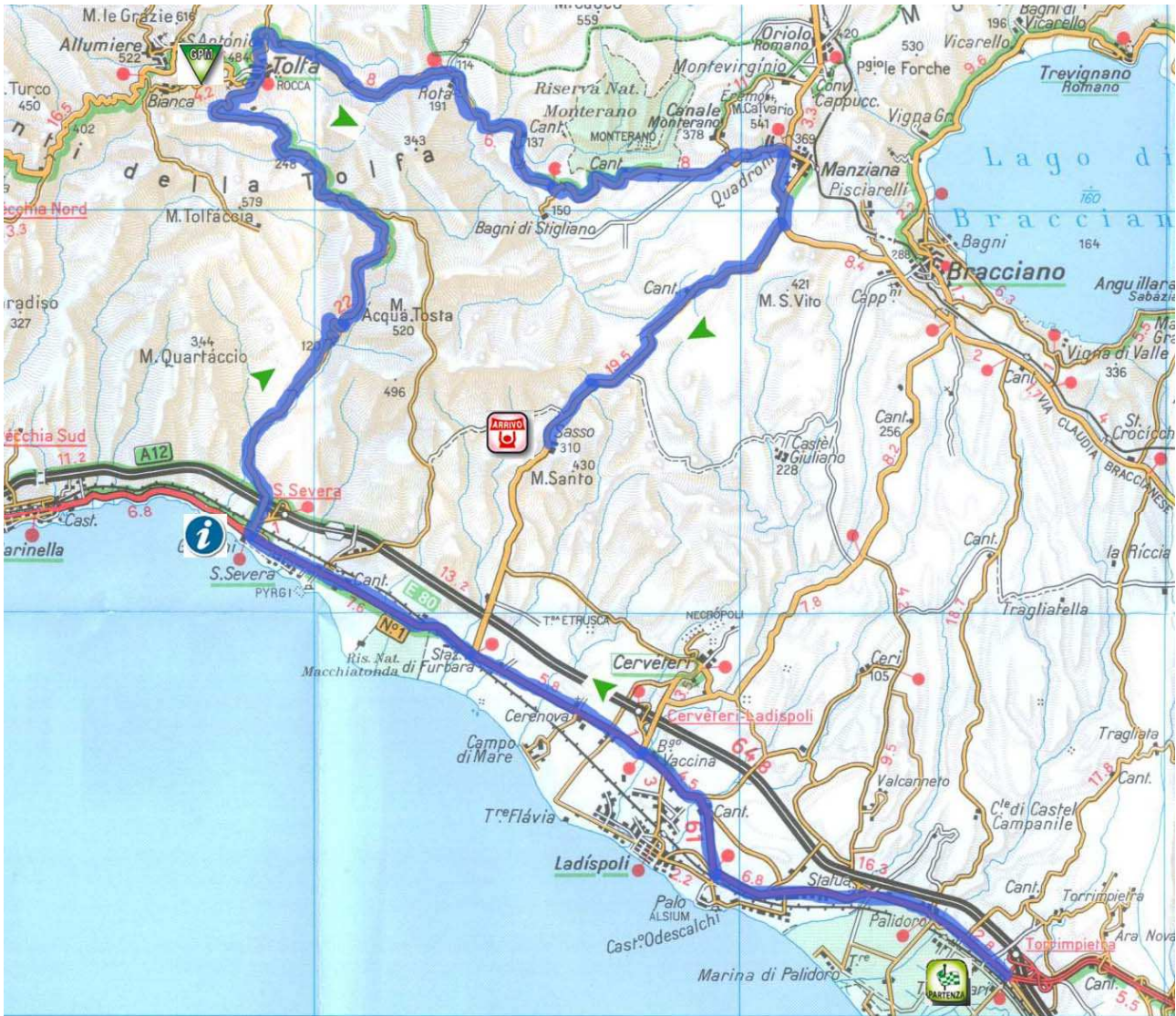
Planimetria Percorso crono tratto blu..

Dislivello da superare mt. 1046 Punto int.: bivio S.Severa per A12